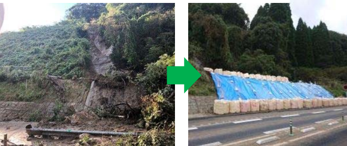
圏央道259. 6KP(茂原長南～市原鶴舞)