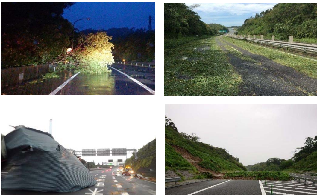
写真1 台風15号通過に伴う高速道路の被害状況

また、千葉県内を中心とする大規模停電により、 高速道路の料金所、休憩施設やトンネルなど最大で58カ所で停電が発生 。