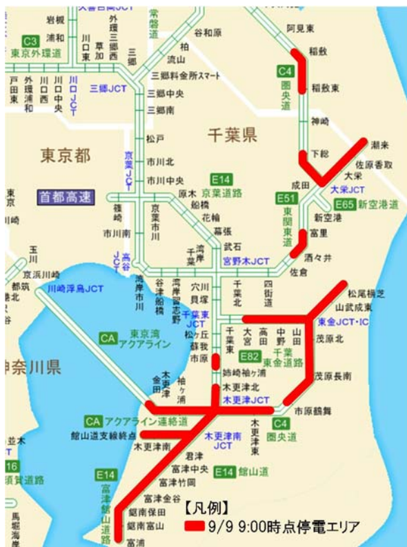
図2 千葉県大規模停電に伴う高速道路の停電区間

各主要施設に設置している 自家発電設備を24時間体制で維持管理 するとともに、自家発電設備のメンテナンスや燃料槽への給油時など、自家発電設備停止時においても電源車などを併用することにより、各設備を長時間停止させることなく、被災地の復旧に必要な交通の確保に努めた。