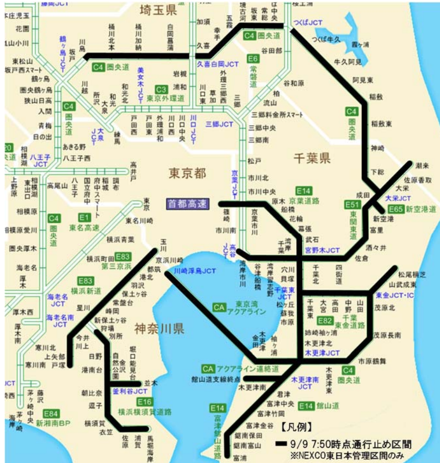
図1 台風15号接近に伴う高速道路の通行止め区間 (NEXCO 東日本管理区間のみ)

特に風が強かった東京湾アクアラインをはじめ、最大12路線、約500kmで通行止めを実施。【詳細は、別紙①(P6)を参照。】