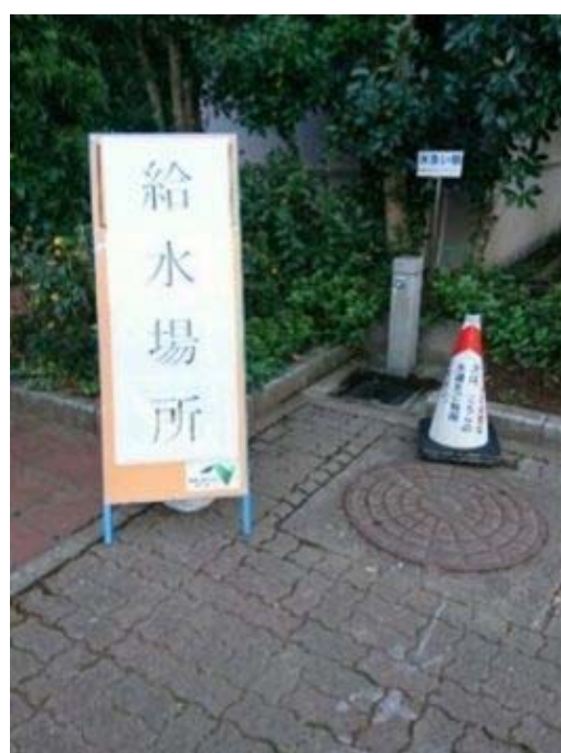
写真4 休憩施設での被災地支援状況