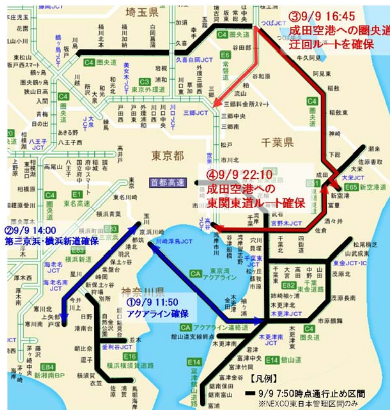
図2 高速道路の通行止め解除区間 (NEXCO東日本管理区間のみ)