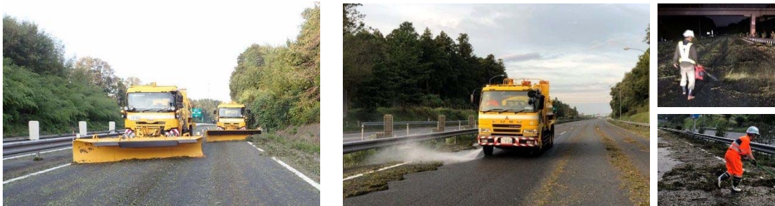
写真2 通行止め解除に向けた作業状況