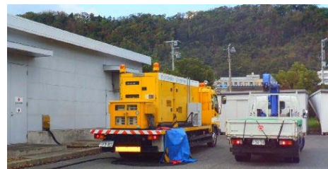
写真3 自家発電設備維持管理状況