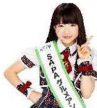
もえの あずきさん