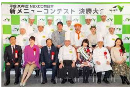
結果発表・記念撮影