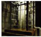
関越トンネル 立坑階段