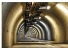
関越トンネル 避難坑

◎現在NEXCO東日本が実施している関越トンネル見学ツアーは、大変好評をいただいております。毎回満席となります。