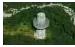
関越トンネル 谷川立坑