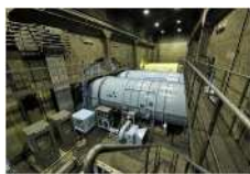
関越トンネル 谷川地下換気所