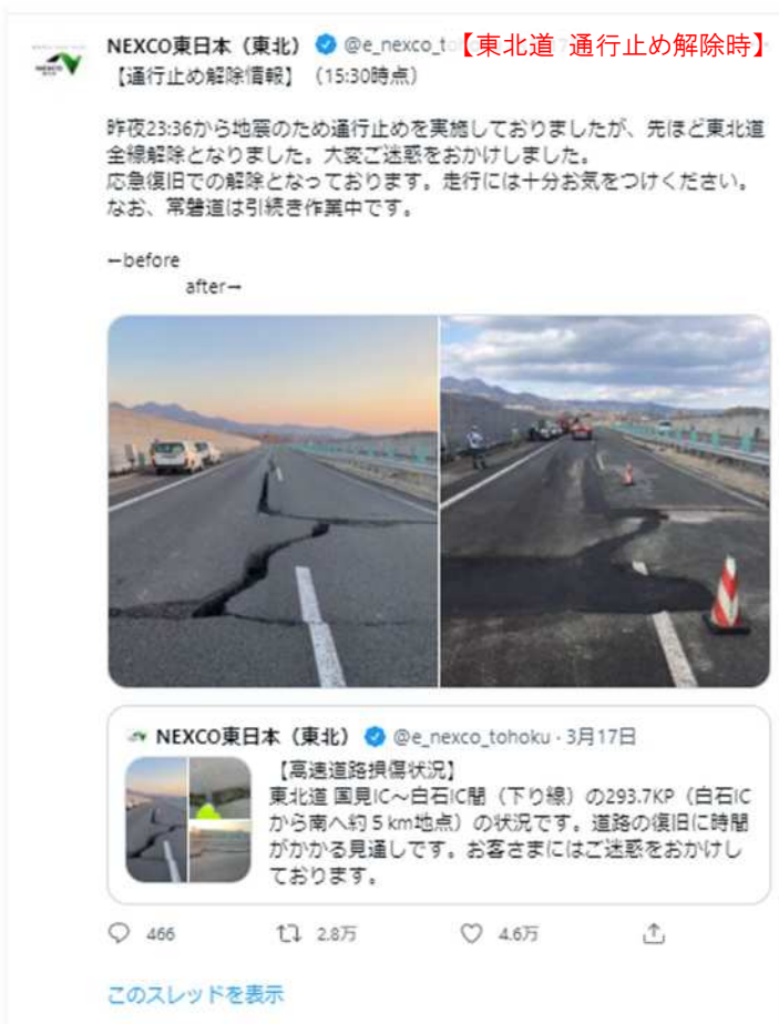
復旧状況のツイート（写真）【東北道】

東北道及び常磐道の応急復旧状況を写真・動画を用いて Twitter でお知らせしたところ、多くの皆さまにご覧いただいた。