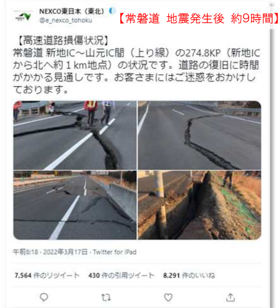
被災状況のツイート（写真）【常磐道】

東北道及び常磐道の応急復旧状況を写真・動画を用いて Twitter でお知らせしたところ、多くの皆さまにご覧いただいた。