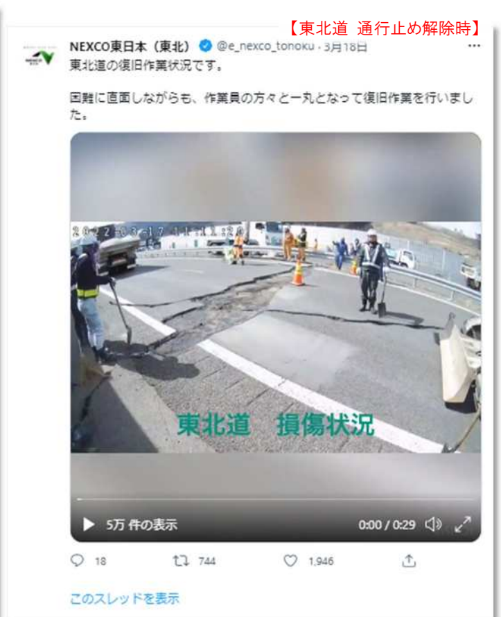
復旧状況のツイート（動画）【東北道】