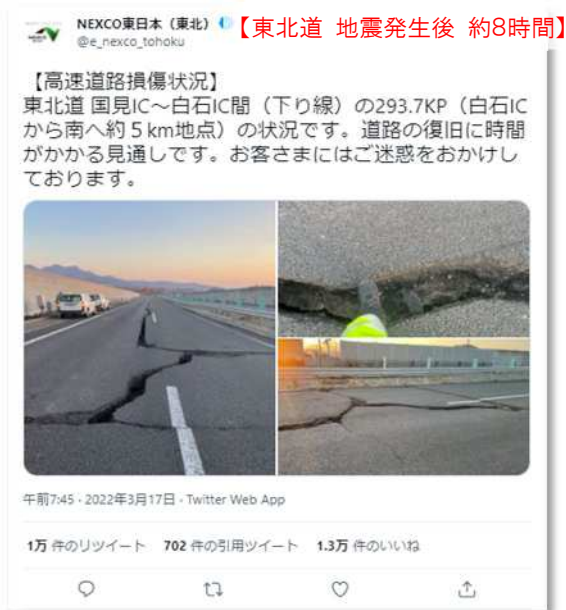
被災状況のツイート（写真）【東北道】