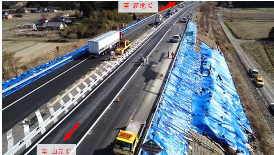
常磐道（新地IC～山元IC）盛土のり面の応急復旧作業

常磐道 新地IC～山元ICでは、盛土のり面の応急復旧作業を引き続き実施しており、速度規制（50 km/h）を実施しております。