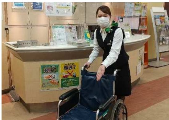
① 車椅子の貸し出し

各インフォメーションでは、ご高齢の方や障がいのある方にも安心してご利用いただくため、①車椅子の貸し出し、②筆談ボードの備え付け、③エリアコンシェルジェによる手話技能検定5級以上の資格等を活用したサービスの提供を行っています。