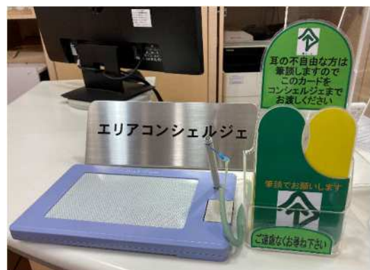
② 備え付けている筆談ボード