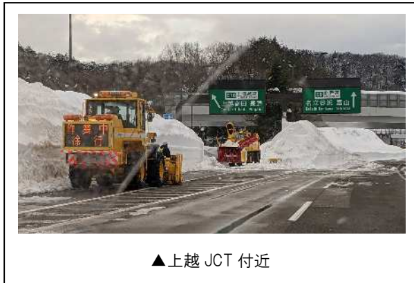
▲上越 JCT 付近