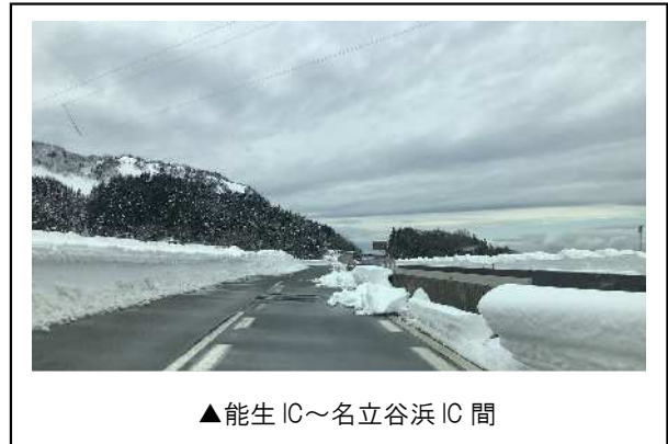
▲能生 IC～名立谷浜 IC 間

当社では引き続き、今後の気象予測に基づき、高速道路への影響(通行止め・チェーン規制など)について、 公式 WEB サイト で情報を提供するほか、 公式 Twitter で各地域の更に詳細な交通規制情報を提供しますので、是非ご確認ください。