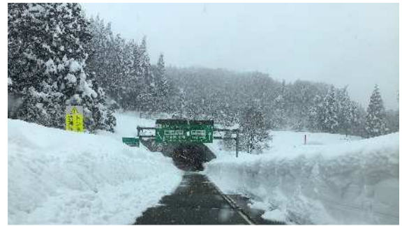
▲名立谷浜 IC～上越 JCT 間(春日山トンネル付近)

当社では引き続き、今後の気象予測に基づき、高速道路への影響(通行止め・チェーン規制など)について、 公式 WEB サイト で情報を提供するほか、 公式 Twitter で各地域の更に詳細な交通規制情報を提供しますので、是非ご確認ください。