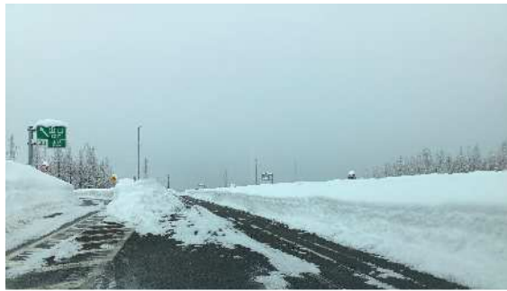
▲上越 IC 出口付近