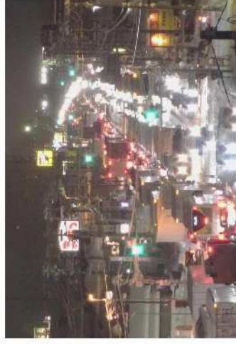
【写③】R2.12.16 国道4号の交通混雑状況