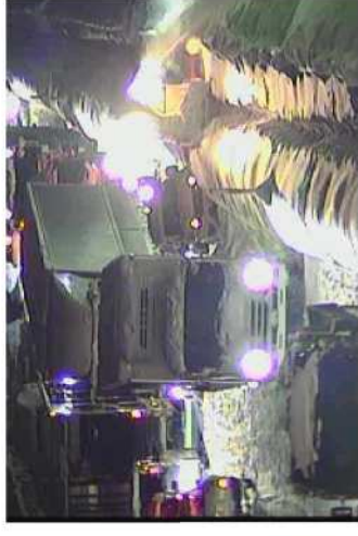
【写②】R2.12.16 国道4号の交通混雑(スタック状況)