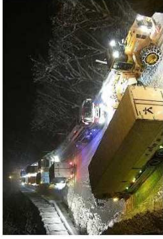
【写①】R2.12.14 国道113号の交通混雑(スタック状況)