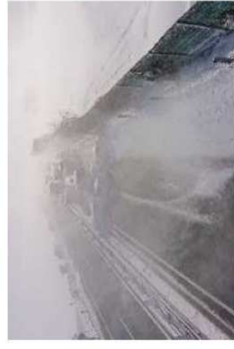
【写④】R3.1.19 E4東北道のホワイトアウト発生状況