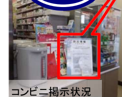
コンビニ掲示状況