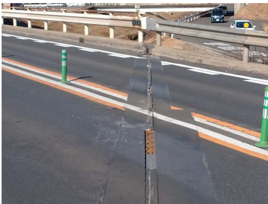
橋りょうの伸縮装置損傷状況