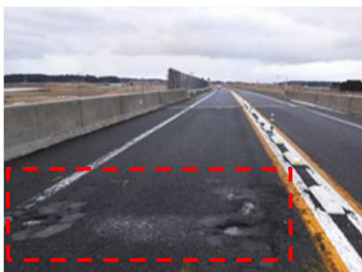
【路面損傷状況(ポットホール)】

4. 作業内容 安全に走行していただける道路環境を維持するための路面補修工事を実施します。