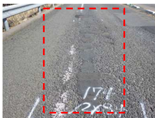
【路面損傷状況(ポットホール)】