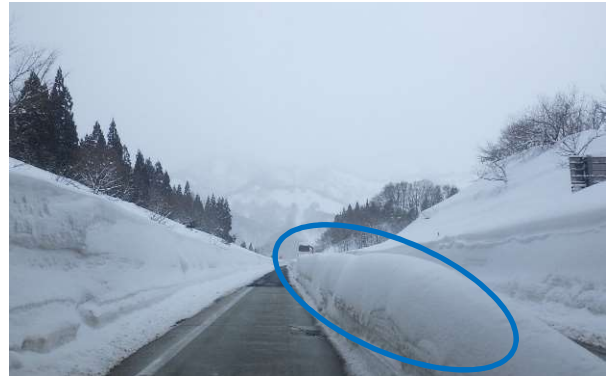
ワイヤーロープ周辺の除雪