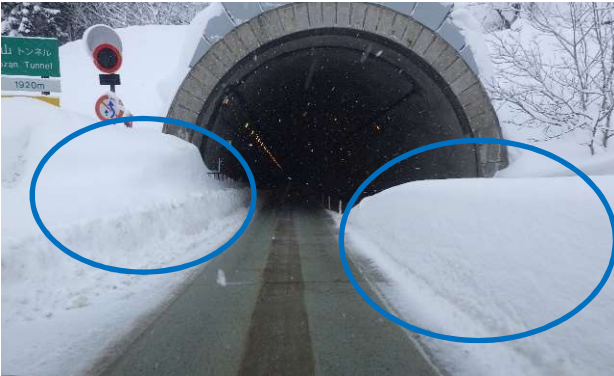
トンネル坑口の除雪

4. 作業内容 安全に走行していただける道路環境を維持するための除雪作業を実施します。