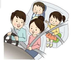
チャイルドシートも忘れずに！

高速道路などの死亡事故で後部座席同乗者の死亡者のうち約7割がシートベルト非着用。全席着用義務となっていますので、後部座席同乗者も必ずシートベルトを着用しましょう！