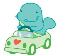
マナーアップキャラクター 「マナーティ」

障がいをお持ちの方や妊婦さんのためのスペースです。 本当に必要な方のために空けておきましょう！