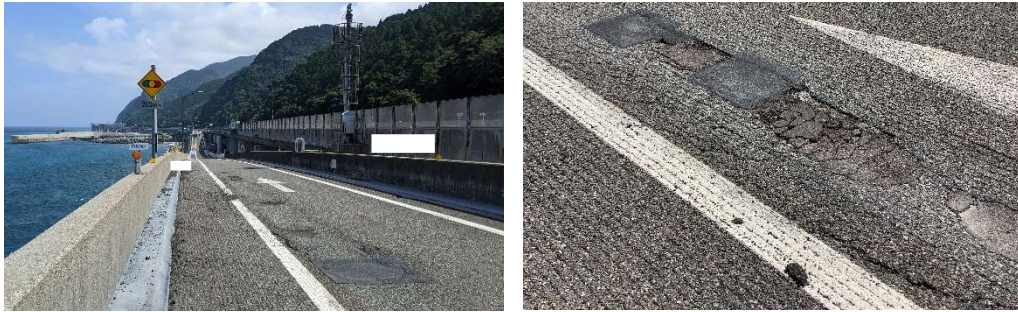
(親不知IC下り線出口ランプの損傷状況)

お客さまが安全・快適に走行できる路面を確保するための工事となりますので、ご理解とご協力をお願いします。