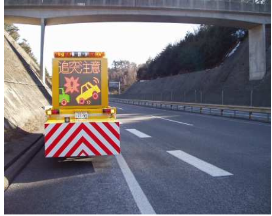
②渋滞末尾への追突注意喚起