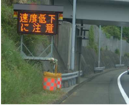
①上り坂などでの速度低下注意喚起