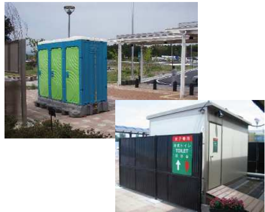
④臨時トイレの設置