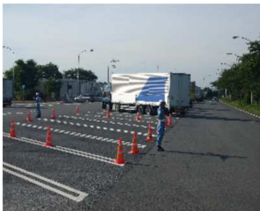
⑤大型車駐車場の確保