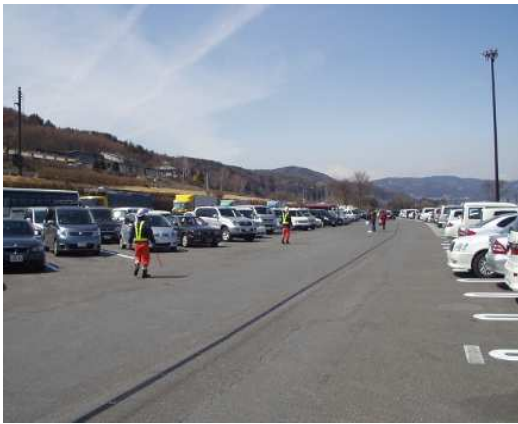
③休憩施設などでの駐車場整理員の配置