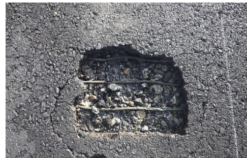
損傷した舗装路面の状況