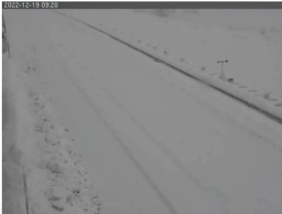
北陸道 中之島見附IC～三条燕IC