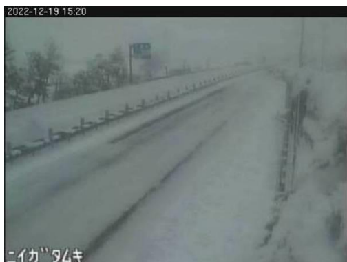
北陸自動車道 巻潟東IC～新潟西IC