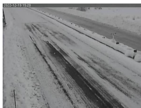
北陸自動車道 中之島見附IC～三条燕IC