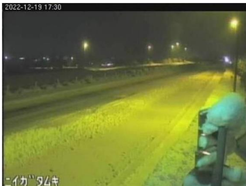
日本海東北自動車道 聖籠新発田IC