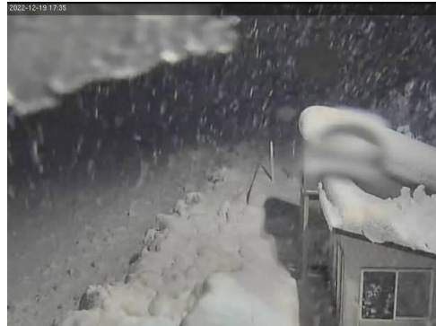
北陸自動車道 柏崎IC～米山IC