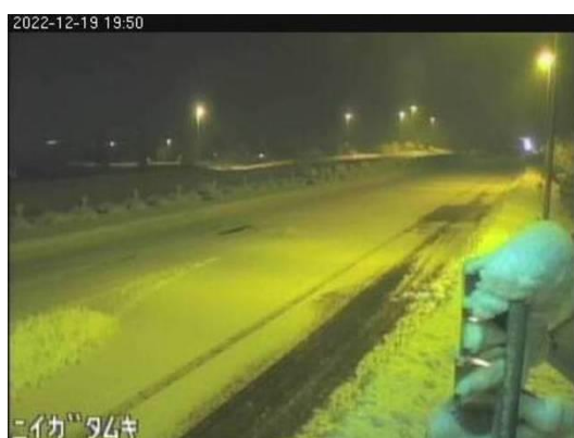
日本海東北自動車道 聖籠新発田IC