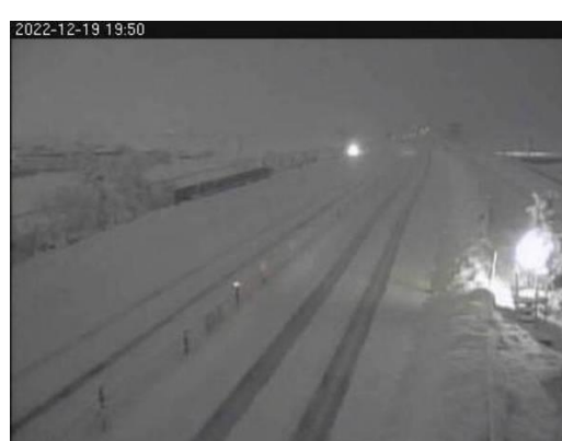
日本海東北自動車道 中条IC～荒川胎内IC