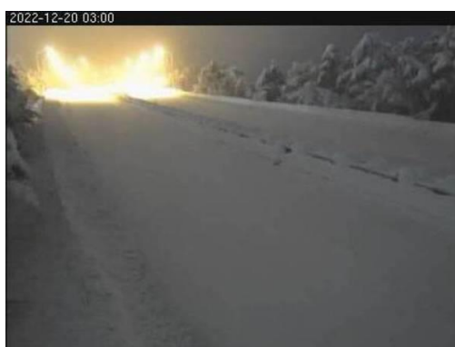
磐越自動車道 安田IC