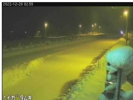
日本海東北自動車道 聖籠新発田IC