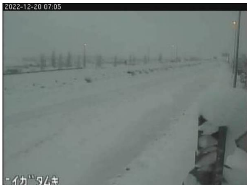
日本海東北自動車道 聖籠新発田IC