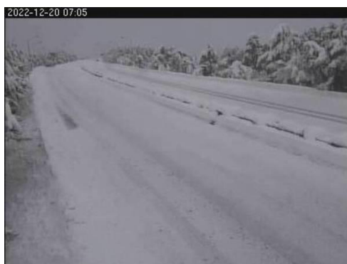
磐越自動車道 安田IC