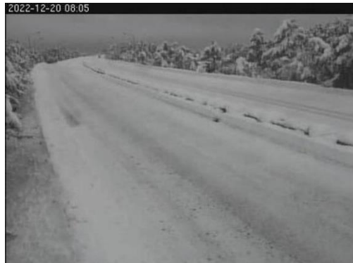
磐越自動車道 安田IC