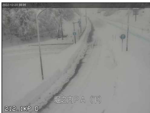
関越自動車道 堀之内IC