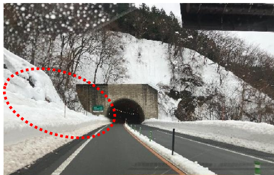
本線路肩部堆雪状況