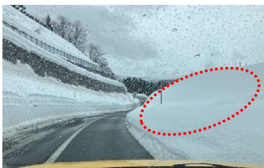
湯殿山 IC 周辺堆雪状況