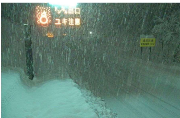
新潟支社管内 北陸道の降雪状況 (令和4年12月19日)

運送事業者及び荷主企業の皆さまにおかれましても、今後の気象予報等をご確認いただき、広域迂回や運送日の調整をご検討いただきますよう、ご協力をお願いいたします。