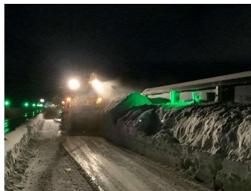
北海道支社管内 後志道の積雪と除雪状況 (令和5年1月10日)