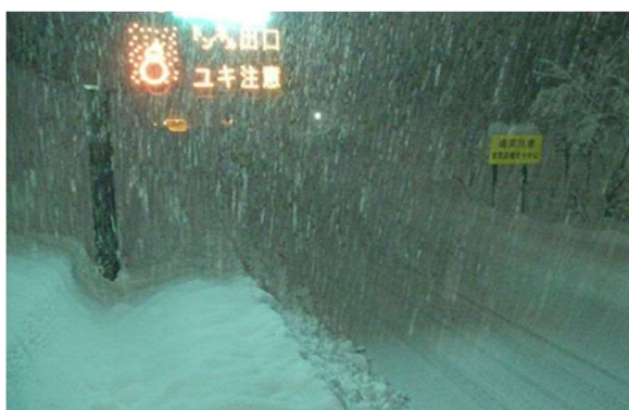
新潟支社管内 北陸道の降雪状況 (令和4年12月19日)

運送事業者及び荷主企業の皆さまにおかれましても、今後の気象予報等をご確認いただき、広域迂回や運送日の調整をご検討いただきますよう、ご協力をお願いいたします。