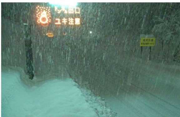
新潟支社管内 北陸道の降雪状況 (令和4年12月19日)

運送事業者及び荷主企業の皆さまにおかれましても、今後の気象予報等をご確認いただき、広域迂回や運送日の調整をご検討いただきますよう、ご協力をお願いいたします。