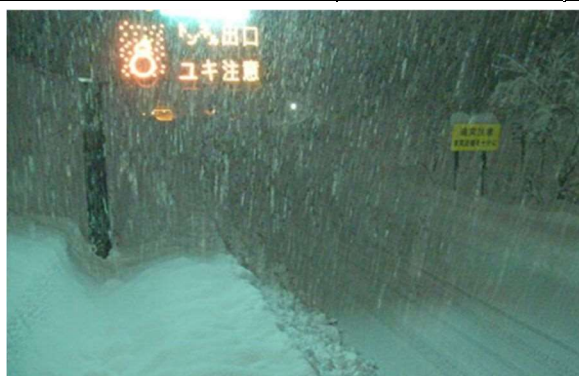
新潟支社管内 北陸道の降雪状況 (令和4年12月19日)