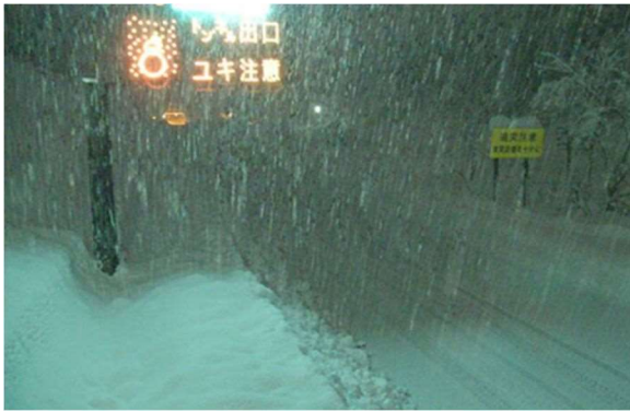
新潟支社管内 北陸道の降雪状況 (令和4年12月19日)