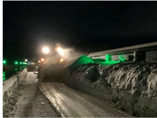
北海道支社管内 後志道の積雪と除雪状況 (令和5年1月10日)