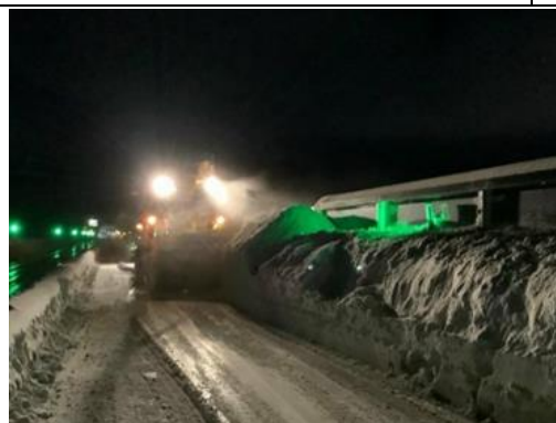
北海道支社管内 後志道の積雪と除雪状況 (令和5年1月10日)