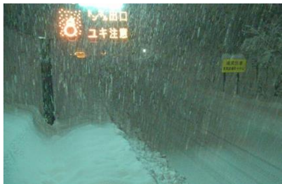
新潟支社管内 北陸道の降雪状況 (令和4年12月19日)

運送事業者及び荷主企業の皆さまにおかれましても、今後の気象予報等をご確認いただき、広域迂回や運送日の調整をご検討いただきますよう、ご協力をお願いいたします。