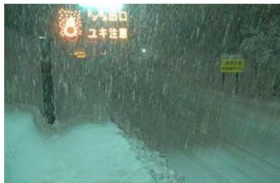
新潟支社管内 北陸道の降雪状況 (令和4年12月19日)

運送事業者及び荷主企業の皆さまにおかれましても、今後の気象予報等をご確認いただき、広域迂回や運送日の調整をご検討いただきますよう、ご協力をお願いいたします。