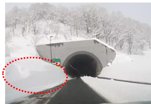
本線路肩部堆雪状況