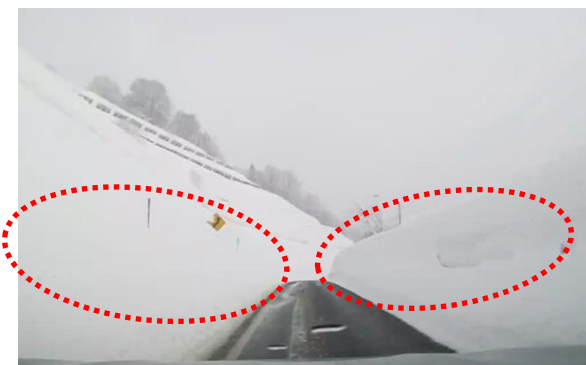
湯殿山 IC 周辺堆雪状況

4. 作業内容 安全に走行していただける道路環境を維持するための除雪作業を実施します。