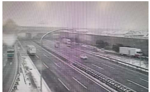
降雪状況 (関越道 鶴ヶ島JCT付近)