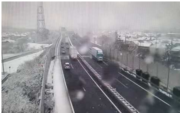
降雪状況 (圏央道 鶴ヶ島JCT付近)