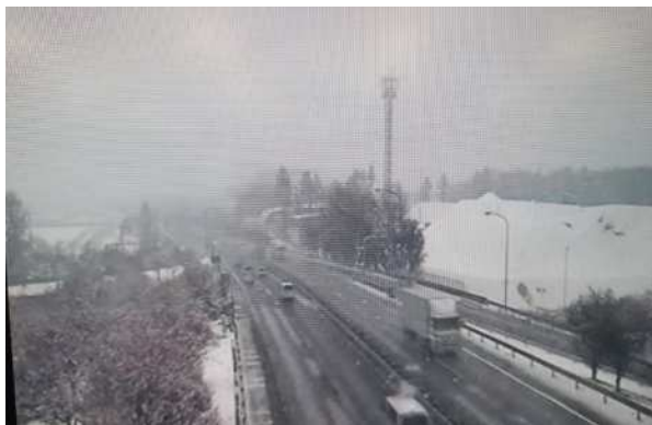
降雪状況 (圏央道 入間IC付近)