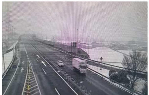
降雪状況 (圏央道 川島IC付近)