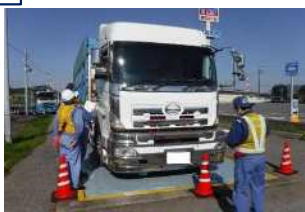
(左)現地取締 (右)自動重量計測装置による取締イメージ

この合同取締の実施により重量超過車両の走行による道路へのダメージや重大事故を削減して、道路ネットワークの長寿命化及び持続的な物流の実現を目指し、安心・安全な社会へ貢献します。