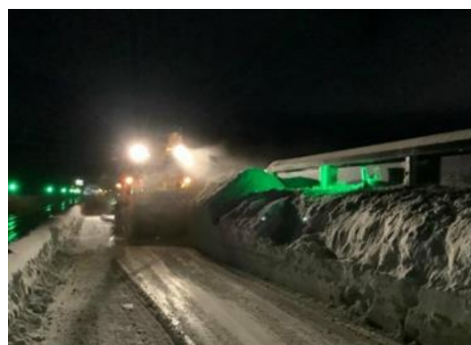
北海道支社管内 後志道の積雪と除雪状況 (令和5年1月10日)