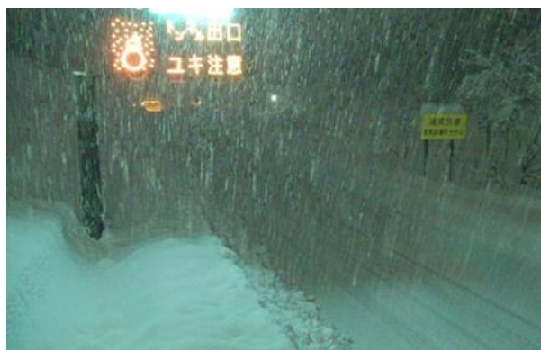
新潟支社管内 北陸道の降雪状況 (令和4年12月19日)

運送事業者及び荷主企業の皆さまにおかれましても、今後の気象予報等をご確認いただき、広域迂回や運送日の調整をご検討いただきますよう、ご協力をお願いいたします。