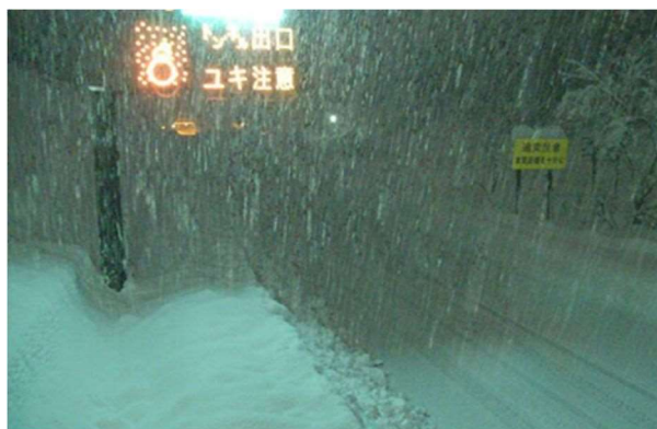
新潟支社管内 北陸道の降雪状況 (令和4年12月19日)

運送事業者及び荷主企業の皆さまにおかれましても、今後の気象予報等をご確認いただき、広域迂回や運送日の調整をご検討いただきますよう、ご協力をお願いいたします。