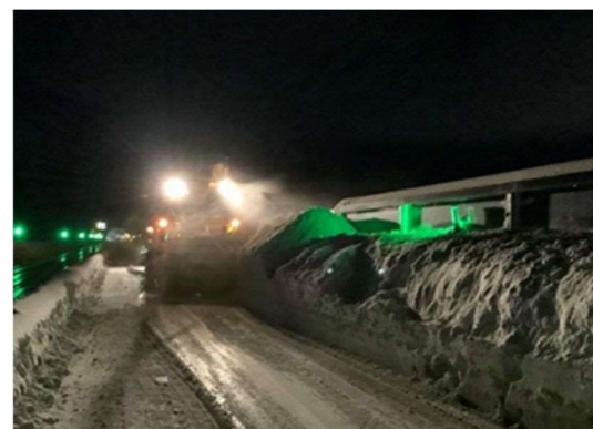
北海道支社管内 後志道の積雪と除雪状況 (令和5年1月10日)