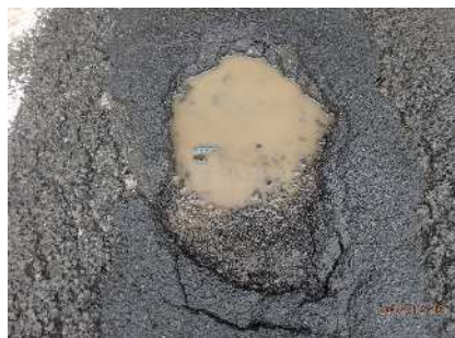
路面損傷の拡大状況(ポットホール)