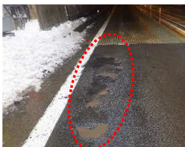
路面損傷状況(ポットホール)