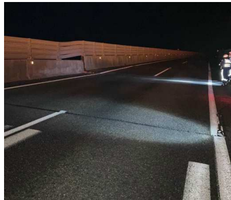
北陸自動車道 能生IC～糸魚川IC 古川橋 (令和6年1月1日)