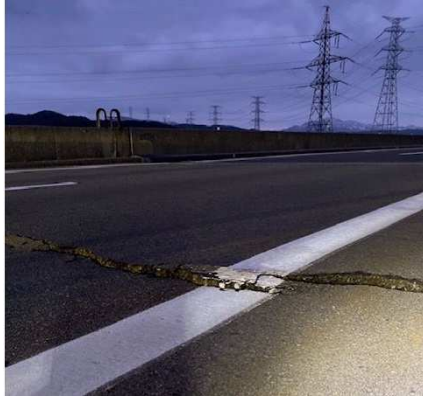
北陸自動車道 西山IC～柏崎IC 吉井川橋 (令和6年1月1日)