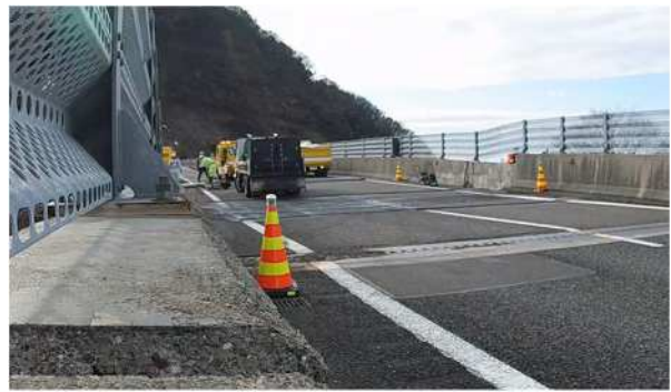
北陸自動車道 能生IC～糸魚川IC 古川橋（令和6年1月2日）