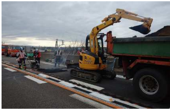
磐越自動車道 新津IC～新潟中央JCT 酒屋高架橋（令和6年1月2日）