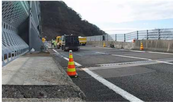
北陸自動車道 能生 IC～糸魚川 IC 古川橋（令和6年1月2日）