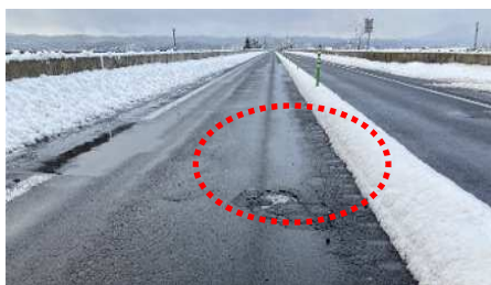
路面損傷状況(ポットホール) ※応急補修は実施済み