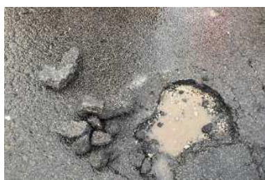
路面損傷の拡大状況(ポットホール) ※応急補修は実施済み