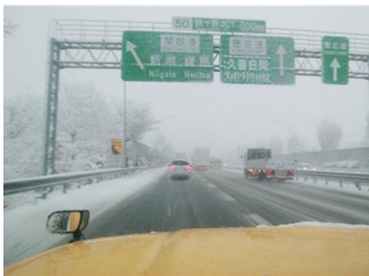
(圏央道 鶴ヶ島JCT付近:積雪状況)