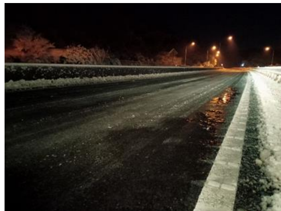
(横浜横須賀道路 横須賀IC付近:路面凍結状況)