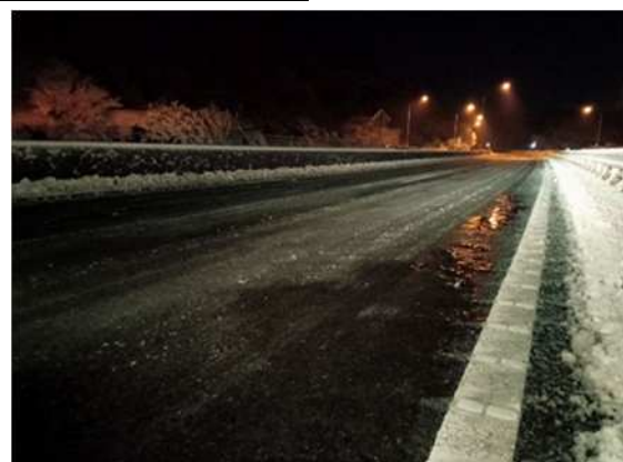
(横浜横須賀道路 横須賀IC付近:路面凍結状況)