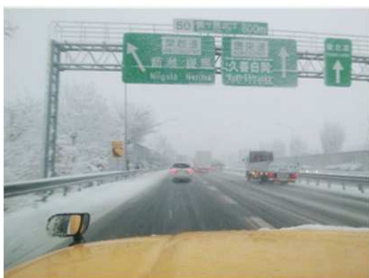
(圏央道 鶴ヶ島JCT付近:積雪状況)