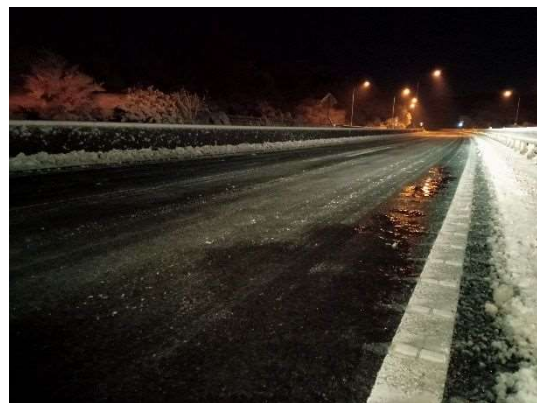
路面凍結状況 (横浜横須賀道路 横須賀IC付近)