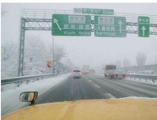
積雪状況 (圏央道 鶴ヶ島JCT付近)