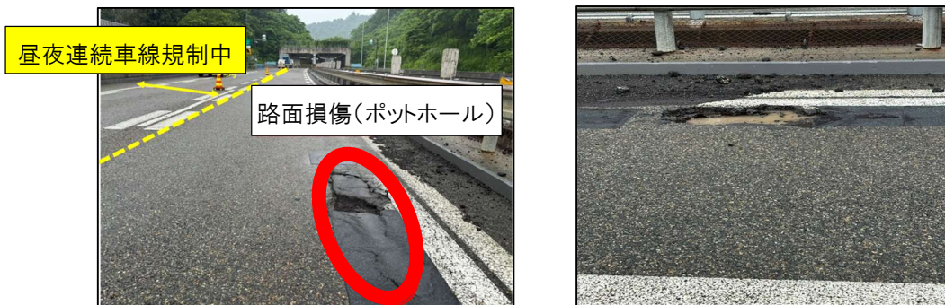
損傷した舗装路面の状況

お客さまが安全・快適に走行できる路面を確保するための工事となりますので、ご理解とご協力をお願いします。