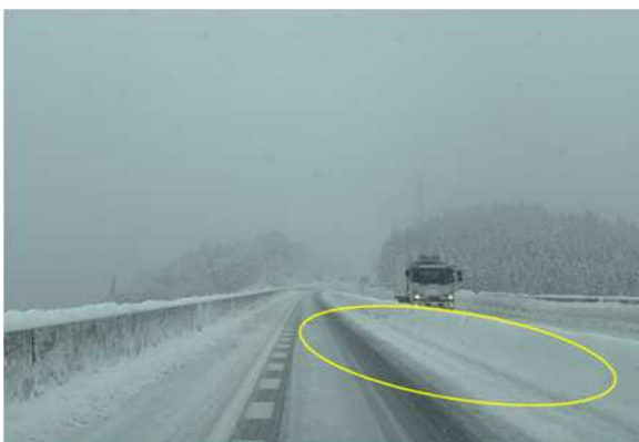
2車線区間における、中央分離帯雪堤処理