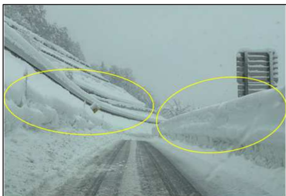
湯殿山 IC ランプの雪堤処理

4. 作業内容 安全に走行していただける道路環境を維持するための除雪作業を実施します。