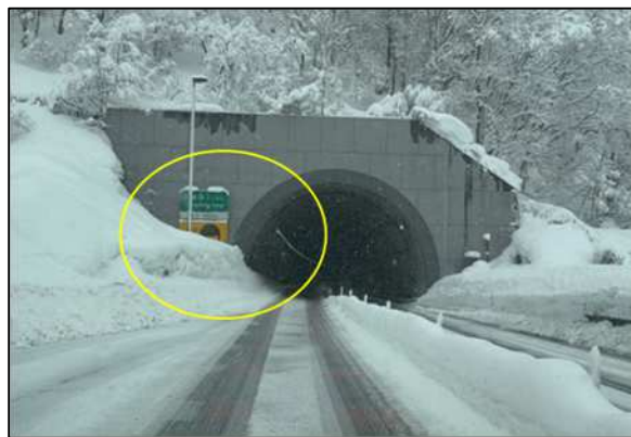
トンネル坑口雪堤処理