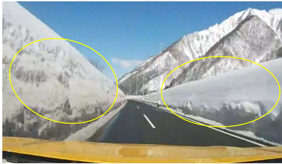
雪庇発生状況((下)158.8KP付近)