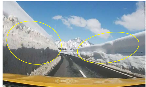
雪庇発生状況((下)163.0KP付近)